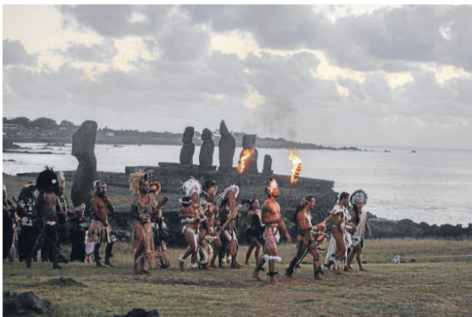
►► Pascuenses en el cierre de la tradicional fiesta Tapati, en febrero de 2016.

des, como el mantenimiento de su idioma (que está en proceso de ser oficializado), los isleños están preocupados de regular el control migratorio. La isla recibe miles de visitantes, pero muchos se están asentando, lo que ha aumentado la población de 2.762 según el Censo de 1992, a cerca de 5.500, según estimaciones actuales, lo que representa un alza de 100% en 25 años, y con una población